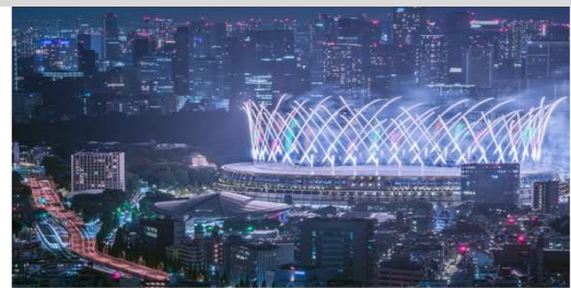
国際的なイベントを支える首都高速道路

首都高メンテナンス西東京株式会社は、首都高グループの一員として2007年4月に設立され、首都圏のひと・まち・くらしを結ぶ安全で円滑な首都高速道路ネットワークの維持修繕業務を行っています。