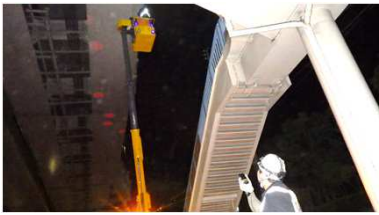
高所作業車上の作業員と監視員との 連絡にハザードトークを使用